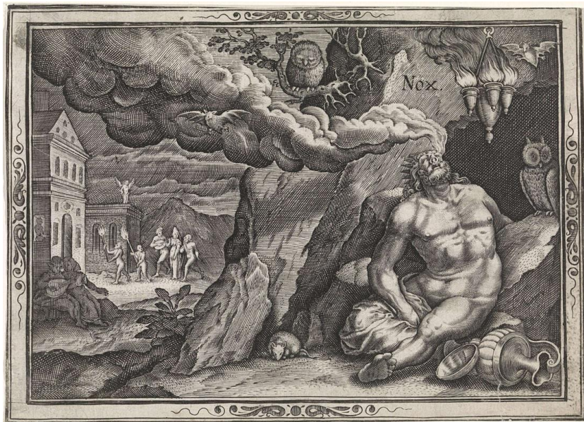
Anonimo – Allegoria della notte - XVII sec.

superare la prova, l'erba dell'immortalità sembrerebbe di conseguenza superflua.