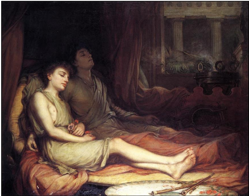
John William Waterhouse - Il Sonno e il suo fratellastro, la Morte - 1874

C ol calare del sole scompare la luce del giorno; ed anche nell'uomo qualcosa inizia ad affievolirsi, come una candela che langue prima di spegnersi. “ Come in alto, così in basso ”, dicevano gli antichi: l'Uomo è la piccola immagine che riassume in sé l'intero Universo, ed anche alla notte che avvolge l'orizzonte corrisponde il torpore del sonno che riempie l'anima umana.