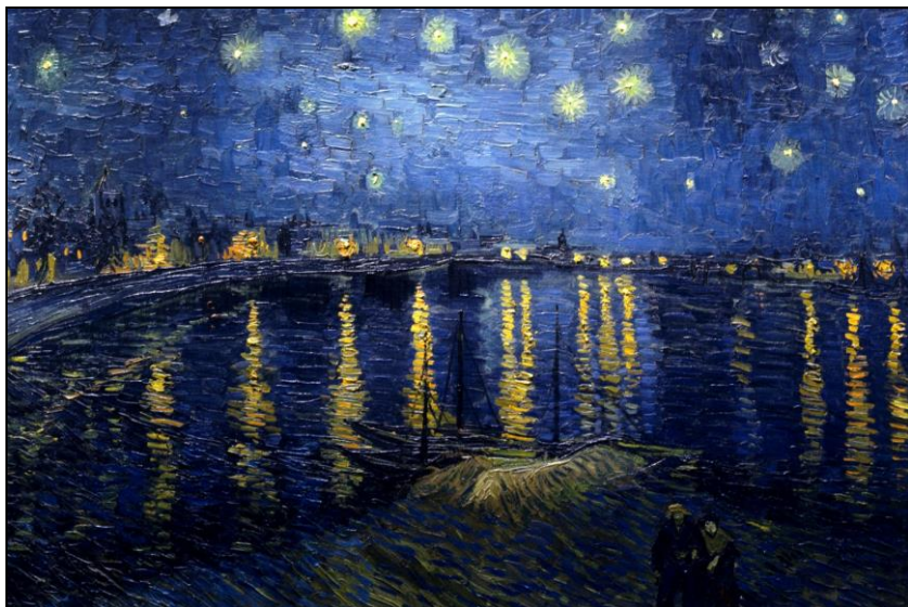
Vincent Van Gogh – Notte stellata sul Rodano - 1888

Così, anche nella notte dell'anima che il dormiente attraversa i meravigliosi regni di Morpheus; e fortunato chi sa portare con sé nel mondo della veglia gli astri di quelle terre incantate!