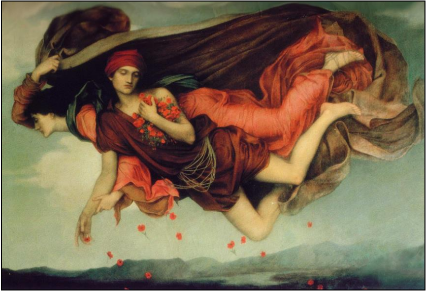
Evelyn De Morgan – La Notte ed il Sonno - 1878

Non è a caso che Esiodo distingue Nyx, la notte, da suo fratello Erebo, l'oscurità. L'oblio della notte non è il silenzio, ma una musica dolce e seducente; ed il suo manto non è nero, ma è un blu profondo trapuntato di stelle meravigliose.