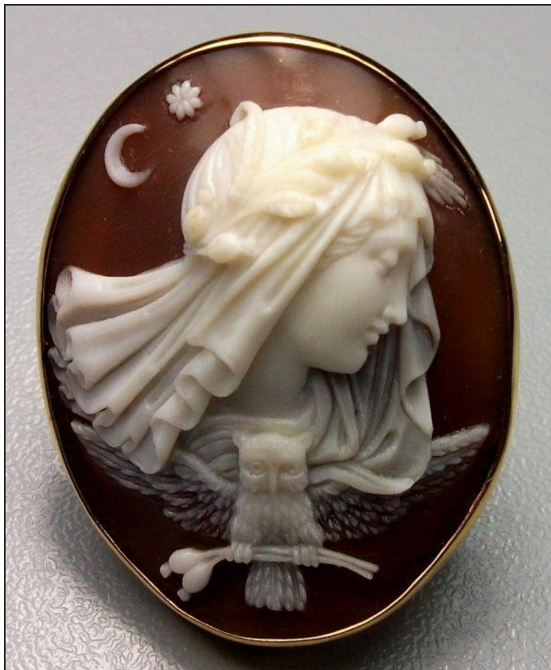
Allegoria della notte - Cammeo in onice - 1870

I bimbi dormono, come nell'incisione di Lucas Kilian; ma qui c'è la Notte a vigilare maternamente su di loro, e persino la sua inseparabile civetta sembra intenerita dalla scena.